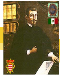
FONDAZIONE MARINO GHETALDI, A.C. DESARROLLO, CULTURA, INVESTIGACIÓN Y FILANTROPIA.