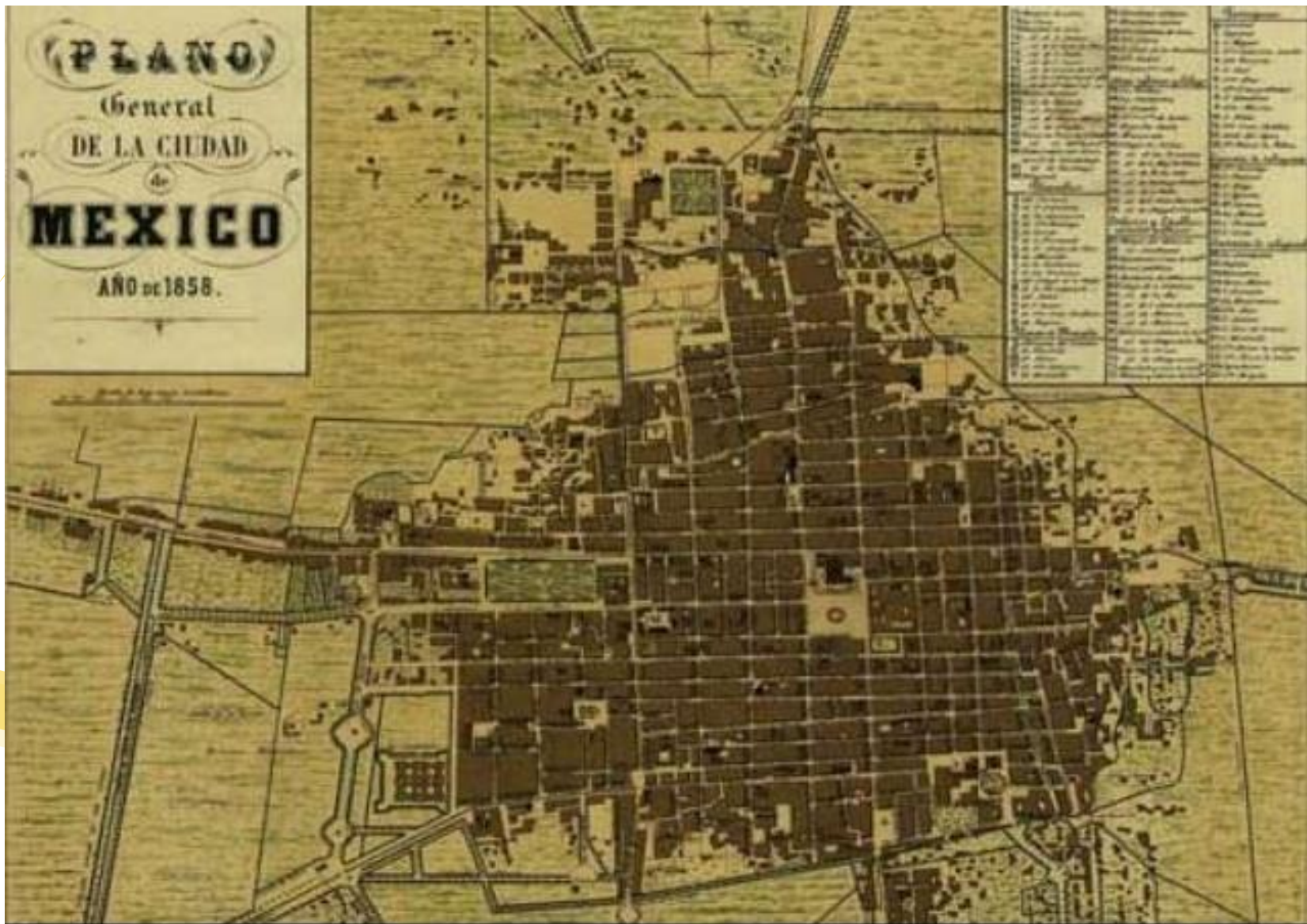
Plano general de la ciudad de México, 1863